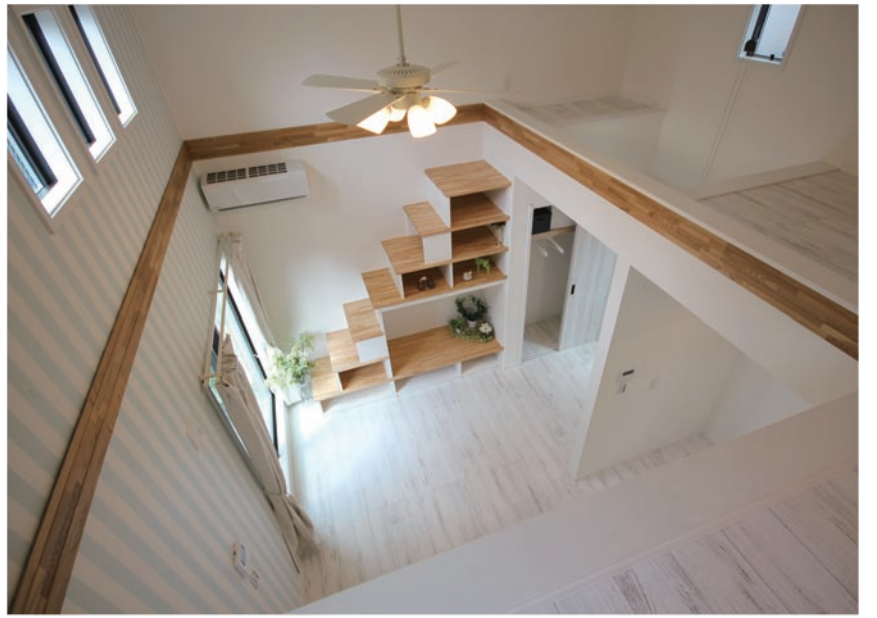
洗練されたインテリアデザインで高い入居率

この連休、住まいのことならトータルでご相談いただけるチャンスです。どうぞお気軽にお越しください！