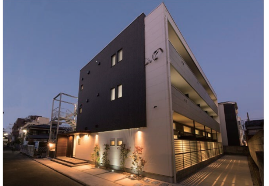
ワンランク上のオーナー物件