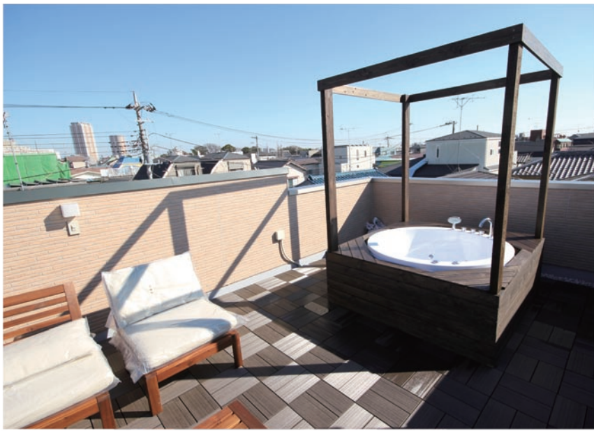
アレンジ自在広々屋上付き住宅