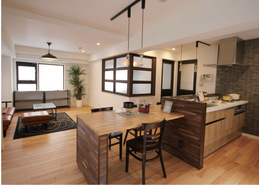
機能性とデザイン性、質の高い居住空間